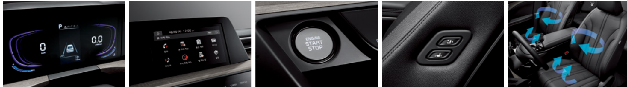
슈퍼비전 클러스터 (4.2인치 칼라 TFT LCD) 8인치 디스플레이 오디오 버튼시동 스마트키 시스템 (원격시동 포함) 동승석 위크인 디바이스 앞좌석 통풍시트*