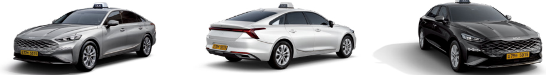
스틸 그레이 (KLG) 스노우 화이트 펄 (SWP) 오로라 블랙 펄 (ABP)