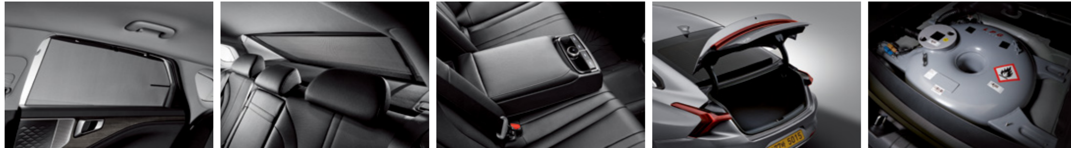
뒷좌석 측면 수동 선커튼 후면 전동 선커튼 뒷좌석 다기능 센터 암레스트 스마트 트렁크 원형 펌배 (3.5 LPI)