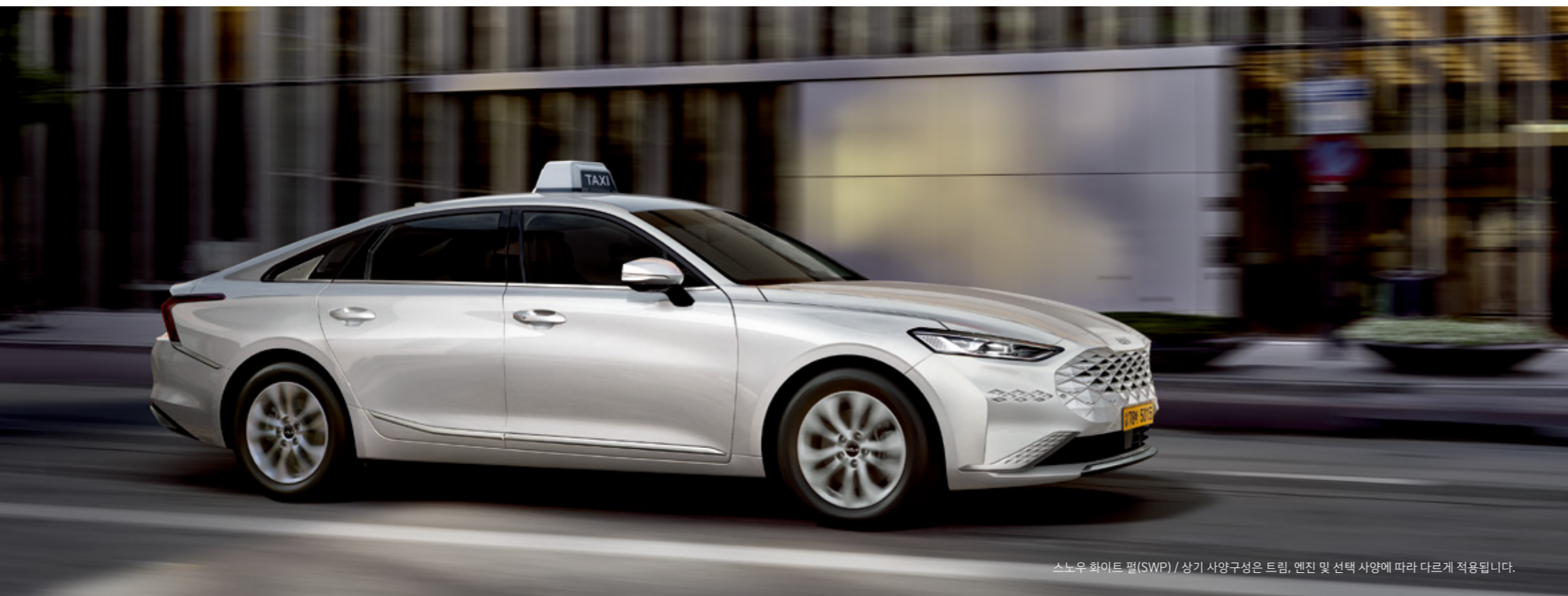
스노우 화이트 펠(SWP) / 상기 사양구성은 트림, 엔진 및 선택 사양에 따라 다르게 적용됩니다.

K8 택시는 실제 주행 여건을 반영한 최적의 엔진 설계와 첨단 운전자 보조 시스템으로 어떠한 도로 상황에서도 한결같은 편안함과 안전함을 제공합니다.