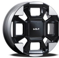
19인치 전면가공 휠 (가솔린/디젤/하이브리드)