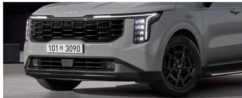
그래비티 전용 블랙 휠, 블랙 라디에이터 그릴