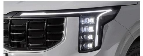
프로젝션 LED 헤드램프, LED 포그램프, 프론트/리어 LED 턴시그널램프, LED 리어 콤비네이션램프