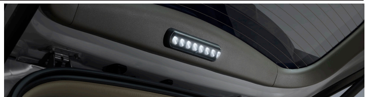
LED 테일게이트 램프