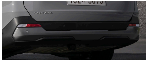
그래비티 전용 갈라 (프론트/리어 스키드 플레이트, 라디에이터 그릴 하단 몰딩, 아웃사이드 미러 커버, 루프랙 상단, 도어 하단 몰딩, C필라/테일게이트 가니쉬)