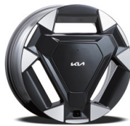
18인치 전면가공 휠 (하이브리드)