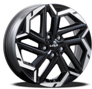
18인치 전면가공 휠 (가솔린/디젤)