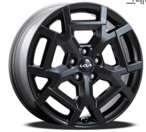
19인치 블랙 휠 (가솔린/디젤/하이브리드)