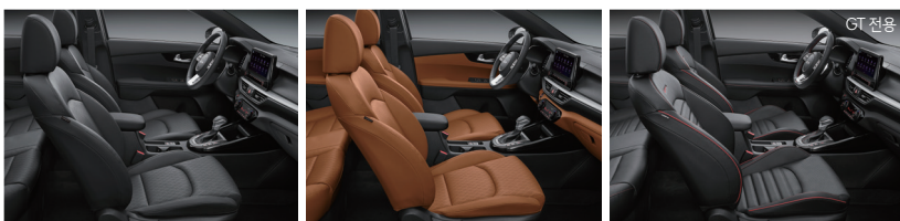
블랙 인테리어(가죽/인조가죽) 오렌지 브라운 인테리어(가죽/인조가죽) 블랙 인테리어(가죽/인조가죽)

※ 본 인쇄물에 수록된 사진의 색상은 인쇄 등 제작 과정을 거치며 실제 차량의 색상과 다소 차이가 발생할 수 있습니다.