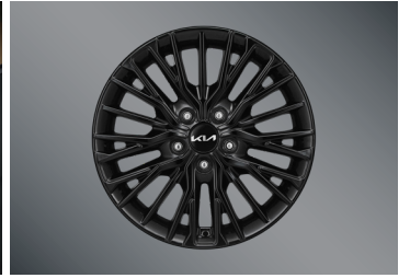
17인치 블랙 휠